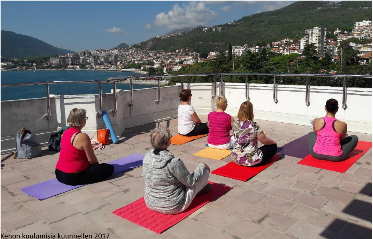
Kehon kuulumisia kuunnellen 2017

HYVÄKSYVÄN VOIMAKIRJOITTAMISEN MATKA MONTENEGROON 21. – 28.9.2019